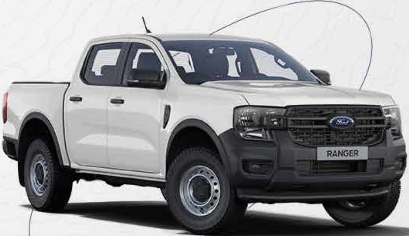
Ranger® XL 4x2