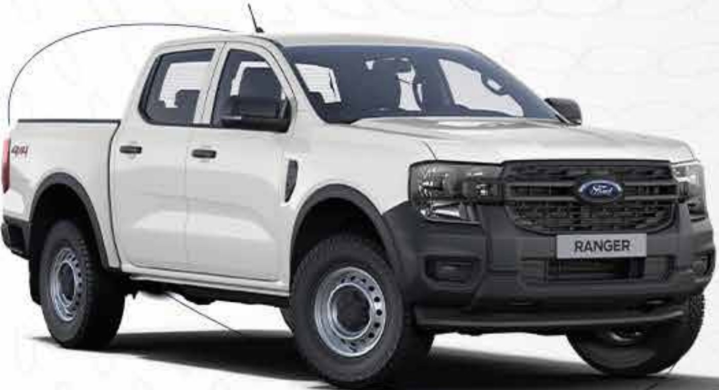
Ranger® XL 4x4