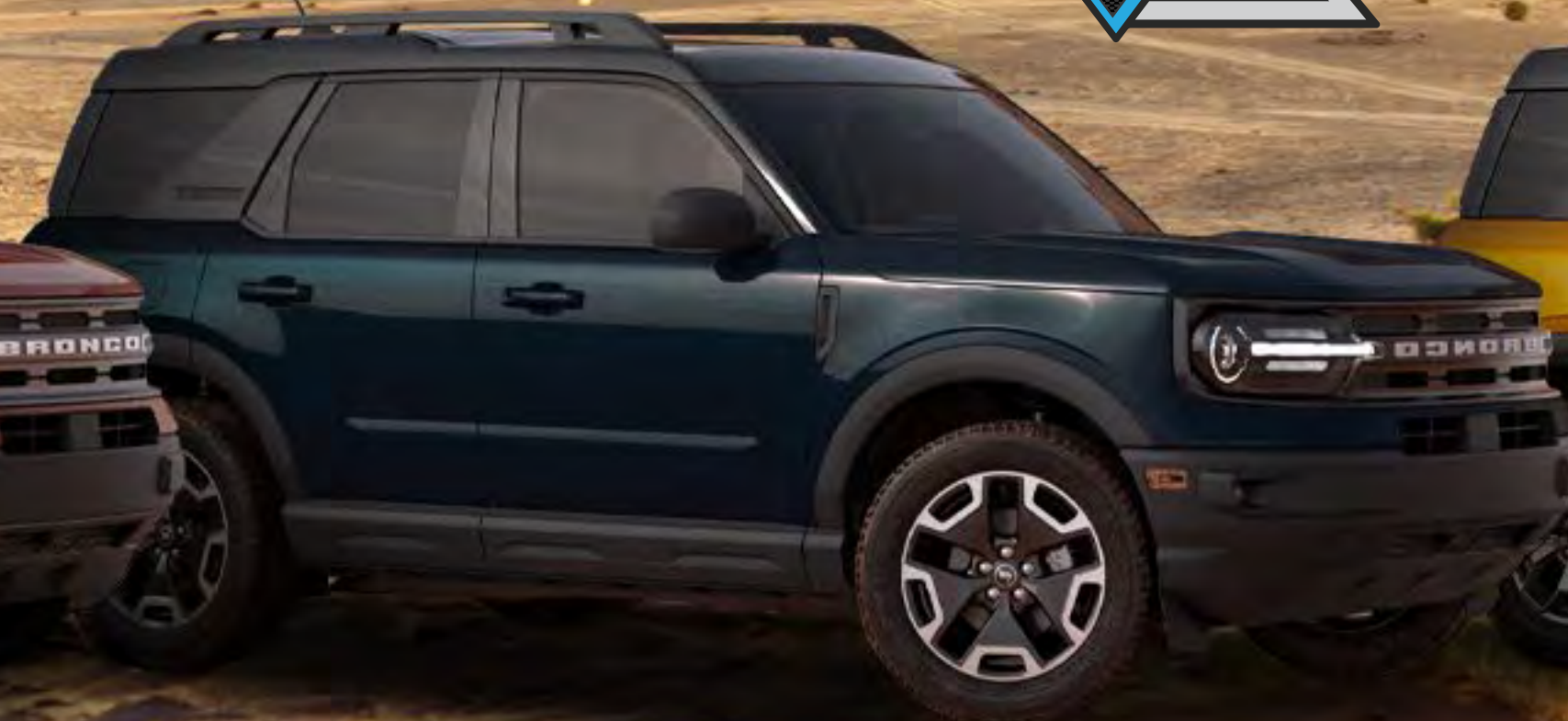
BLACK DIAMOND 4X4