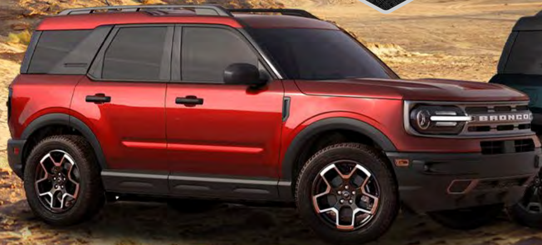
BIG BEND 4X4